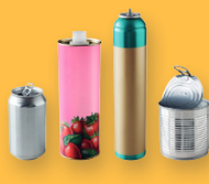
TOUS LES EMBALLAGES EN MÉTAL