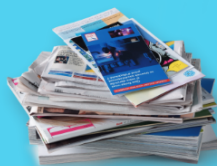
MAGAZINES ET PROSPECTUS