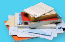
LIVRES, CAHIERS, BLOC-NOTES

Les cartonnettes et films en plastique doivent être retirés et triés avec les emballages