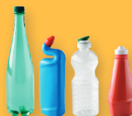
TOUS LES FLACONS, BIDONS ET BOUTEILLES