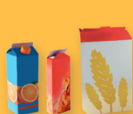
TOUS LES EMBALLAGES EN CARTON