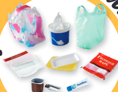
TOUS LES AUTRES EMBALLAGES