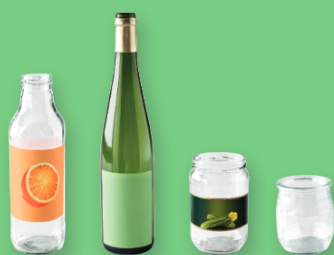
BOUTEILLES, BOCAUX ET POTS